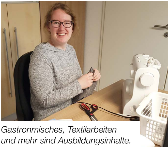
Gastronomisches, Textilarbeiten und mehr sind Ausbildungsinhalte.